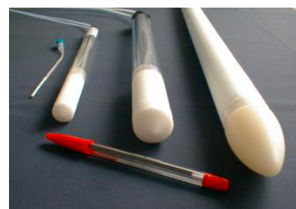
Différentes tailles de cellules de prélèvement en plastique

Document-BA-ecotech-cellule-prelevement-plastique-FR-20190426