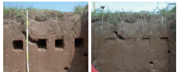
Fosse pédologique avec tunnels d'installation ouverts (à gauche) et après installation de quatre plaques en verre (à droite)