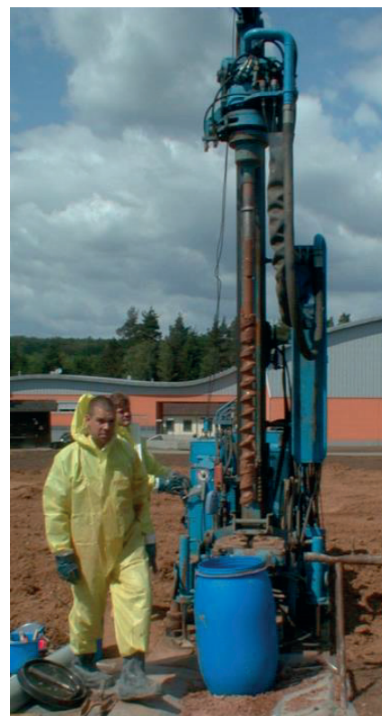
Forage profond pour cellules de prélèvement à des fins de surveillance des effets de dépollution sur site à risque